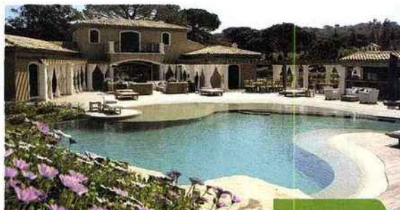
FORMES LIBRES Les piscines « hollywoodiennes » sont moins populaires qu'avant. Elles restent les plus chères du marché : 40 000 € environ.