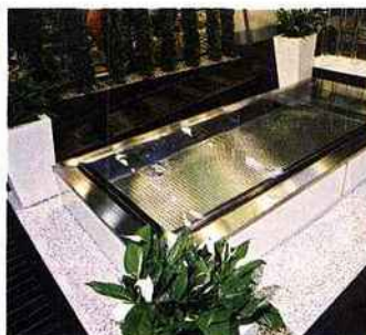
INOX Effets miroir, jeux de couleurs : les nouveaux fabricants s'essaient aux effets de mode. Mais cette modernité fait grimper les prix.