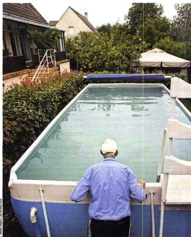
Le prix des piscines hors sol, entre 700 et 2 000 €, les rend plus accessibles.