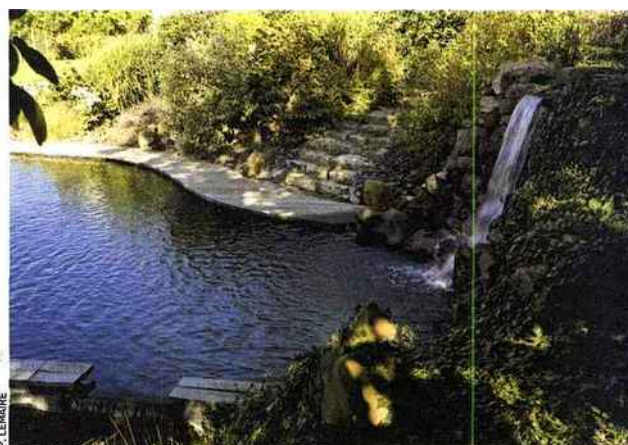
Les piscines naturelles offrent une eau filtrée sans aucun produit chimique.